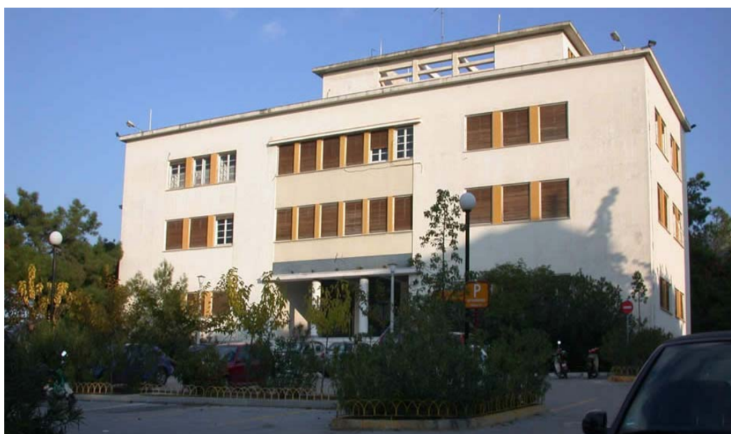
Κτήριο Εργαστηρίου Εφαρμοσμένης Υδραυλικής

Ο Τομέας Υδατικών Πόρων και Περιβάλλοντος έχει ως αντικείμενο την επιστημονική διερεύνηση από ποσοτική και ποιοτική άποψη του υδάτινου περιβάλλοντος και τη μελέτη και κατασκευή των συναφών έργων Πολιτικού Μηχανικού. Αναλυτικότερα ο Τομέας καλύπτει εκπαιδευτικά και ερευνητικά τις γνωστικές περιοχές της Υδραυλικής, της Υδρολογίας και των Υδατικών Πόρων, των Υδραυλικών Έργων και ειδικότερα των Υδρεύσεων, των Εγγειοβελτιωτικών Έργων (Αρδρεύσεις, Στραγγίσεις - Αποξηράνσεις), των Αντιπλημμυρικών Έργων και της Περιβαλλοντικής και Υγειονομικής Τεχνολογίας, της Θαλάσσιας Υδραυλικής και των Λιμενικών Έργων, της Ενέργειας και των Υδροηλεκτρικών Έργων. Στον Τομέα λειτουργούν τέσσερα εργαστήρια: