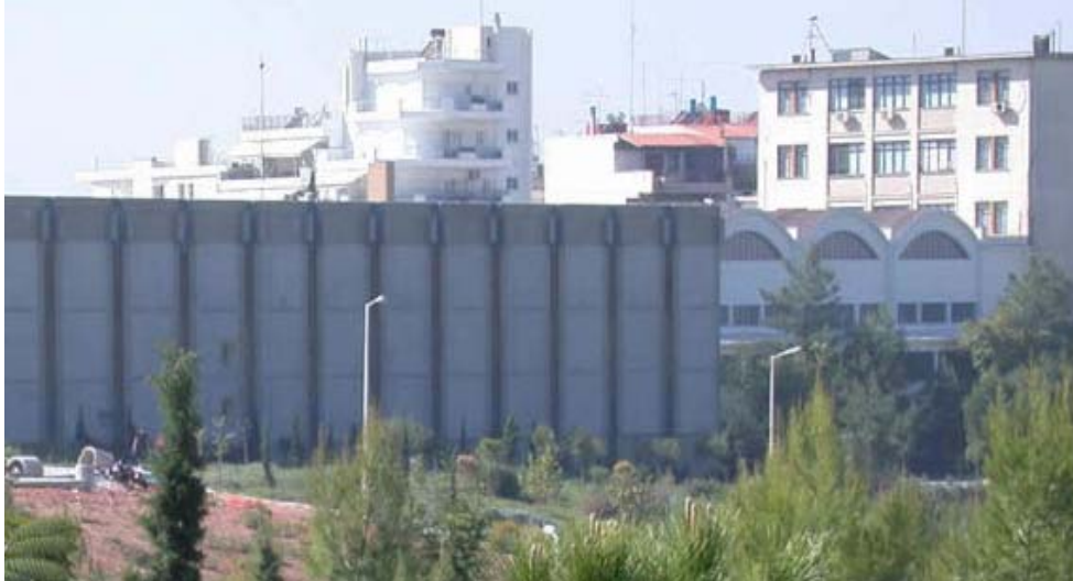
Κτήριο Εργαστηρίου Λιμενικών Έργων

Ο Τομέας πραγματοποιεί βασική και εφαρμοσμένη έρευνα σε περιοχές αιχμής αλλά και σε σημαντικά ειδικά θέματα και καλύπτει σήμερα ορισμένες ζωτικής σημασίας επιστημονικές και τεχνολογικές ανάγκες των Δημοσίων και Ιδιωτικών αναπτυξιακών φορέων. Η έρευνα προωθείται κυρίως μέσω χρηματοδοτούμενων ερευνητικών προγραμμάτων, Ελληνικών και της Ευρωπαϊκής Ένωσης. Εκπονούνται διδακτορικές διατριβές, διπλωματικές εργασίες και επιστημονικές εκθέσεις είτε παράλληλα και συμπληρωματικά με τη χρηματοδοτούμενη έρευνα, είτε ανεξάρτητα από αυτή. Τα μέλη ΔΕΠ του Τομέα διδάσκουν προπτυχιακά μαθήματα στη Σχολή Πολιτικών Μηχανικών, ορισμένα από τα οποία απευθύνονται σε όλους τους φοιτητές Πολιτικούς Μηχανικούς και άλλα στους φοιτητές που ακολουθούν την κατεύθυνση του Υδραυλικού Μηχανικού. Επίσης διδάσκουν μαθήματα στη Σχολή Αγρονόμων και Τοπογράφων Μηχανικών του Ε.Μ.Π..