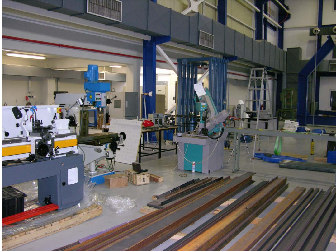
Εργαστήριο Μεταλλικών Κατασκευών