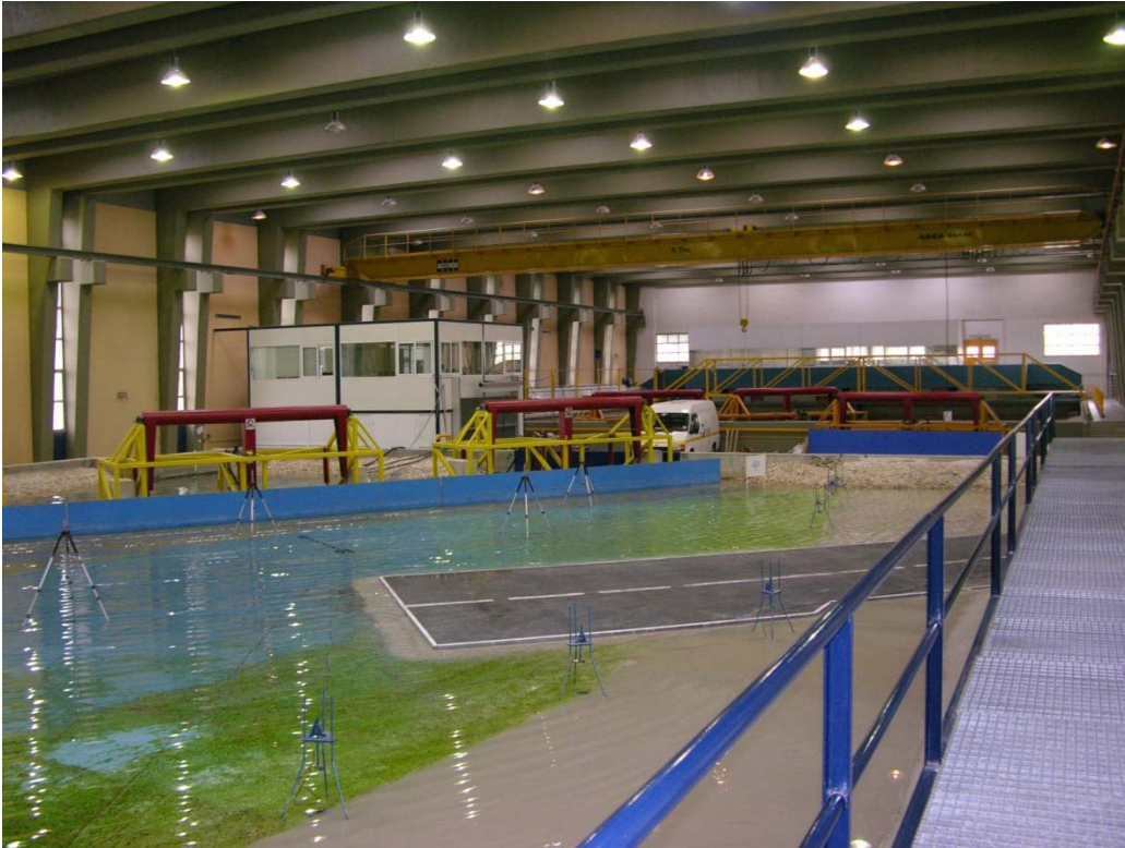
Εργαστήριο Λιμενικών Έργων