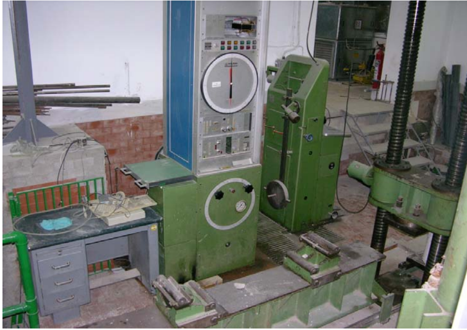
Εργαστήριο Οπλισμένου Σκυροδέματος