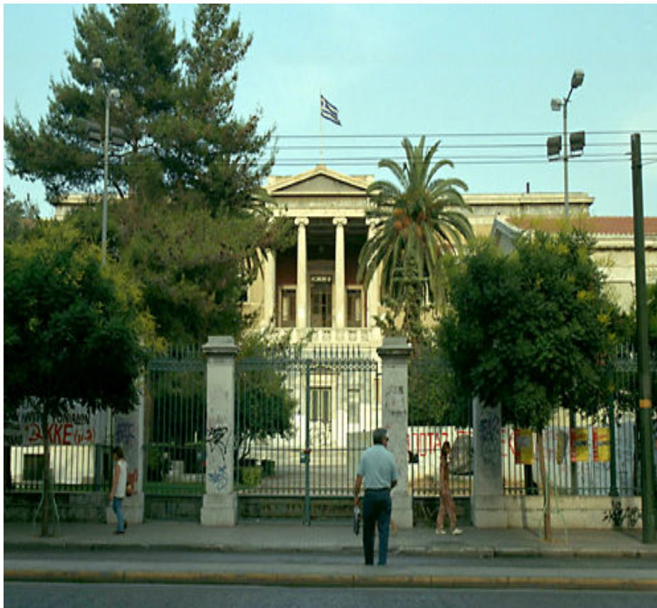
Το ιστορικό ίδρυμα του Εθνικού Μετσόβιου Πολυτεχνείου επί της οδού Πατησίων.

Το Εθνικό Μετσόβιο Πολυτεχνείο (Ε.Μ.Π.) είναι, ως εκ της φυσικής και νομικής δομής του, Ανώτατο Εκπαιδευτικό Ίδρυμα (Α.Ε.Ι.). Στα πλαίσια του άρθρου 16 του ισχύοντος Συντάγματος, του άρθρου 1 του Ν.1268/82, της παράδοσής του και της ανθρώπινης και υλικοτεχνικής υποδομής του, το Ε.Μ.Π., μέσω της αδιάσπαστης ενότητας των σπουδών και της έρευνας, έχει ως πρωτεύουσα θεσμική συνιστώσα της αποστολής του την παροχή ανώτατης παιδείας διεκεκριμένης ποιότητας και την προαγωγή των επιστημών και της τεχνολογίας.