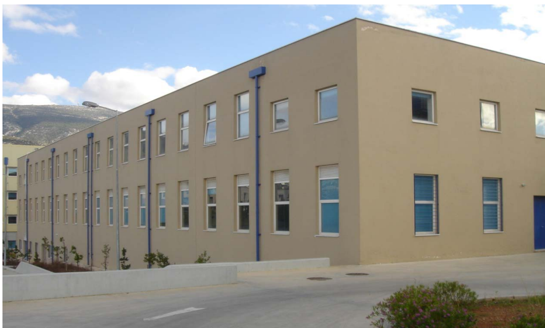
Κτήριο Τομέα Γεωτεχνικής

Ο Τομέας Γεωτεχνικής καλύπτει εκπαιδευτικά και ερευνητικά τα αντικείμενα της Εδαφομηχανικής, Βραχομηχανικής, των Θεμελιώσεων και λοιπών Γεωτεχνικών Έργων, της Τεχνικής Γεωλογίας, της Περιβαλλοντικής Γεωτεχνικής και της Γεωτεχνικής Σεισμικής Μηχανικής. Το περιεχόμενο των μαθημάτων καθώς και η ερευνητική δραστηριότητα του Τομέα καλύπτουν θέματα σχετικά με τη θεωρητική, εργαστηριακή και επί τόπου διερεύνηση της μηχανικής συμπεριφοράς εδαφών και βράχων, τη δυναμική απόκριση των εδαφικών σχηματισμών, την κίνηση του υπογείου νερού, γεωλογικά θέματα έργων μηχανικού, τις θεμελιώσεις των τεχνικών έργων, τις εκσκαφές και αντιστηρίξεις, την ευστάθεια φυσικών πρανών, τις βελτιώσεις εδαφών, τα φράγματα και αναχώματα, τις σήραγγες και τα Ειδικά Γεωτεχνικά Έργα και τέλος θέματα προστασίας του γεωπεριβάλλοντος καθώς και μικροζωνικές μελέτες και έρευνες.