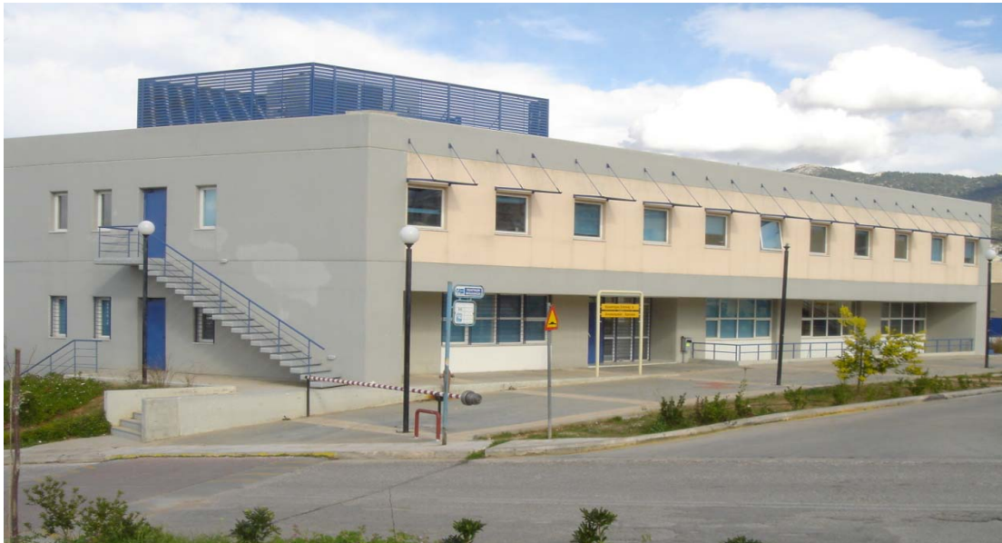
Κτήριο Εργαστηρίου Στατικής και Αντισεισμικών Ερευνών