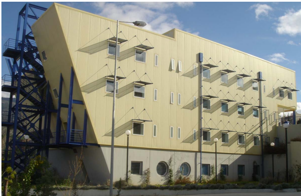
Κτήριο Εργαστηρίου Μεταλλικών Κατασκευών

Μια σειρά υποχρεωτικών, κατ' επιλογήν και προαιρετικών μαθημάτων δίνει την ευκαιρία στους φοιτητές να γνωρίσουν σε βάθος την Επιστήμη του Πολιτικού Μηχανικού και ιδιαίτερα τον κλάδο των Δομοστατικών. Η διδασκαλία αρχίζει από το 4ο εξάμηνο σπουδών με τη Στατική των ισοστατικών και υπερστατικών φορέων, που αποτελεί, μαζί με την Αντοχή των Υλικών, τη βάση για τα τεχνολογικά μαθήματα της περιοχής αυτής και συνεχίζεται στα μεγαλύτερα εξάμηνα με το Οπλισμένο και Προεντεταμένο Σκυρόδεμα, τις Σιδηρές Κατασκευές και Σιδηρές Γέφυρες, καθώς και τα μαθήματα Αντισεισμικής Τεχνολογίας. Η παρεχόμενη γνώση συμπληρώνεται με εργαστηριακές επιδείξεις και ασκήσεις, με θέματα έτους, τα οποία αναφέρονται σε πραγματικές κατασκευές, καθώς και με επισκέψεις σε