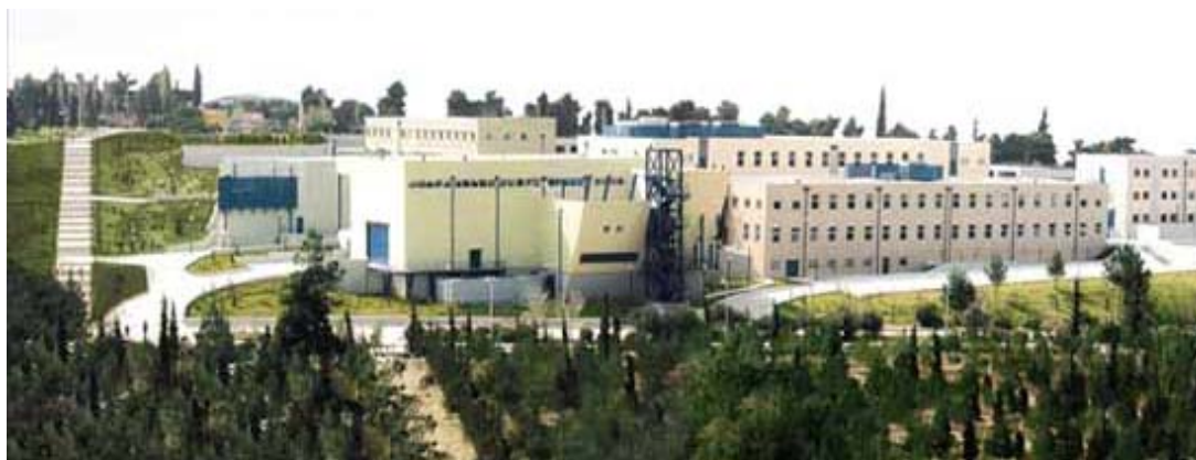
Συγκρότημα Νέων κτηρίων Σχολής Πολιτικών Μηχανικών

Η Σχολή Πολιτικών Μηχανικών του Εθνικού Μετσόβιου Πολυτεχνείου, η αρχαιότερη Σχολή Πολιτικών Μηχανικών της χώρας, στη διάρκεια της μακρόχρονης λειτουργίας της, έχει διαδραματίσει πρωταγωνιστικό ρόλο στην επιστημονική, τεχνολογική και οικονομική ανάπτυξη της χώρας. Σε ταραγμένες αλλά και ήρεμες περιόδους της ελληνικής ιστορίας το 19 ο και τον 20 ο αιώνα, οι απόφοιτοι της Σχολής απετέλεσαν σταθερή αναφορά και θεμέλιο της οικοδόμησης (και ανοικοδόμησης) της χώρας και των κτηριακών, υδραυλικών και συγκοινωνιακών υποδομών της. Συχνά οι απόφοιτοί της ξεπέρασαν τα σύνορα της χώρας και άφησαν τη σφραγίδα τους στο παγκόσμιο επιστημονικό και τεχνολογικό γίγνεσθαι. Ο 21 ος αιώνας με το μεγαλύτερο από ποτέ άνοιγμα των συνόρων που έχει επιφέρει, αλλά και τις σημαντικές ανακατατάξεις σε καθιερωμένες δομές, αξίες και λειτουργίες που προοιωνίζεται, βάζει τη Σχολή μπροστά σε προκλήσεις και προβληματισμούς.