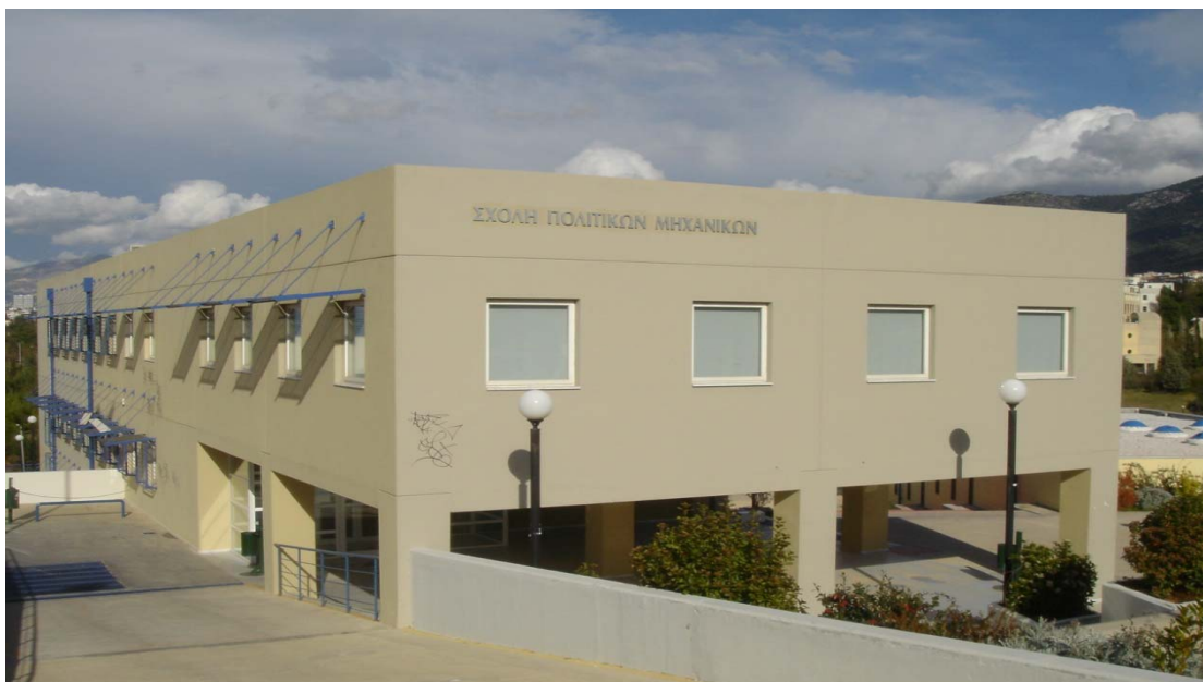
Κτήριο Διοίκησης Σχολής Πολιτικών Μηχανικών.

αποτέλεσμα την αύξηση της απασχόλησης. Άλλωστε, η σπατάλη πόρων κατά την κατασκευή και διαχείριση ενός έργου ή ο τραυματισμός του περιβάλλοντος, είναι πράξεις ασυμβίβαστες με την αποστολή του πολιτικού μηχανικού. Μεγάλος επομένως αριθμός νέων συναδέλφων πρέπει να ασχοληθεί αποκλειστικά με τον εκσυγχρονισμό, την ορθολογική διαχείριση και την περιβαλλοντική αποκατάσταση μέσα και γύρω από τα υπάρχοντα έργα Π.Μ.