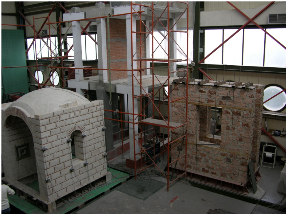
Εργαστήριο Αντισεισμικής Τεχνολογίας