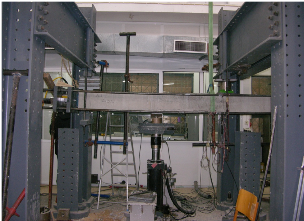
Εργαστήριο Οπλισμένου Σκυροδέματος