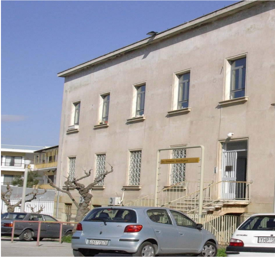
Κτήριο Εργαστηρίου Οπλισμένου Σκυροδέματος