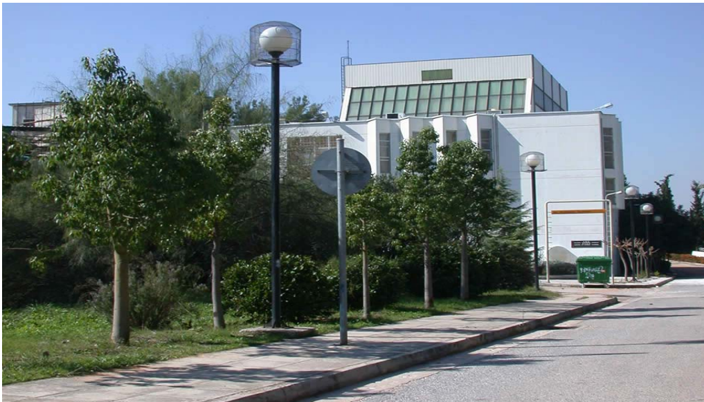
Κτήριο Εργαστηρίου Αντισεισμικής Τεχνολογίας