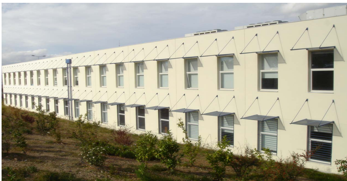
Κτήριο αιθουσών διδασκαλίας.