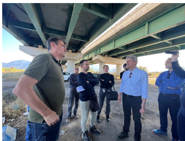
Ξεnáγηση και τεχνική ενημέρωση στη γέφυρα Τιθορέας