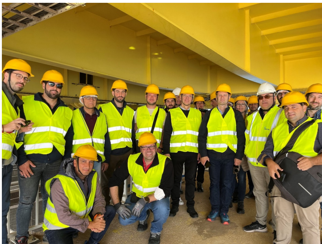
Ομαδική φωτογραφία στον πυλώνα Μ4 κάτω από την ανωδομή της γέφυρας.

Θερμές ευχαριστίες οφείλονται στους εργαζομένους της « ΓΕΦΥΡΑ Α.Ε. » και ιδιαίτερως στον κ. Π. Παπανικόλα , Πρόεδρο και Διευθύνοντα Σύμβουλο, καθώς επίσης και στον κ. Α. Σταθόπουλο –Βλάμη , Τεχνικό Διευθυντή, για την άρτια διοργάνωση της επίσκεψης και τις πολύ κατατοπιστικές παρουσιάσεις τους.