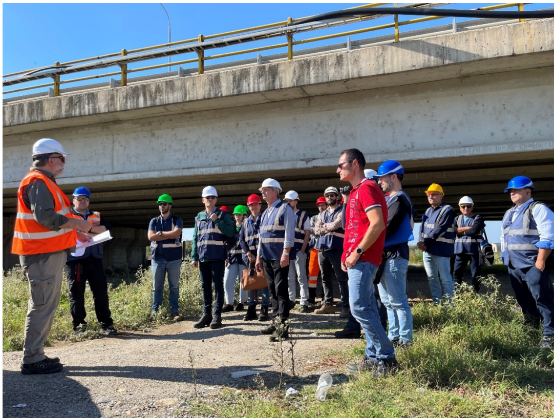
Ενημέρωση στον Νότιο Κλάδο Γέφυρας ποταμού Αλιάκμονα

Πραγματοποιήθηκε επιθεώρηση και καταγραφή φθορών/βλαβών σε γέφυρα Κάτω Διάβασης (στην περιοχή Μεθώνης Πιερίας), ενώ στις Οδικές Γέφυρες του ποταμού Αλιάκμονα έγινε ξενάγηση στις γέφυρες Βορείου (προς Θεσ/νικη) & Νοτίου (προς Αθήνα) κλάδου, παρουσίαση εργασιών ανακατασκευής του Βορείου κλάδου και αναφορά σε αξιολογήσεις και δοκιμές που έχουν γίνει στο παρελθόν στον Νότιο κλάδο.