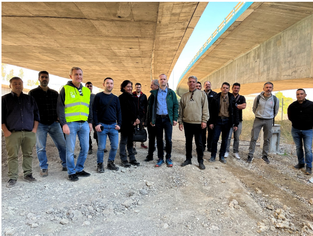
Ομαδική φωτογραφία στο Τεχνικό Β040 Γεφύρωσης του Ισθμού στον χώρο πέριξ των μεσοβάθρων στην πλευρά της Πελοποννήσου.