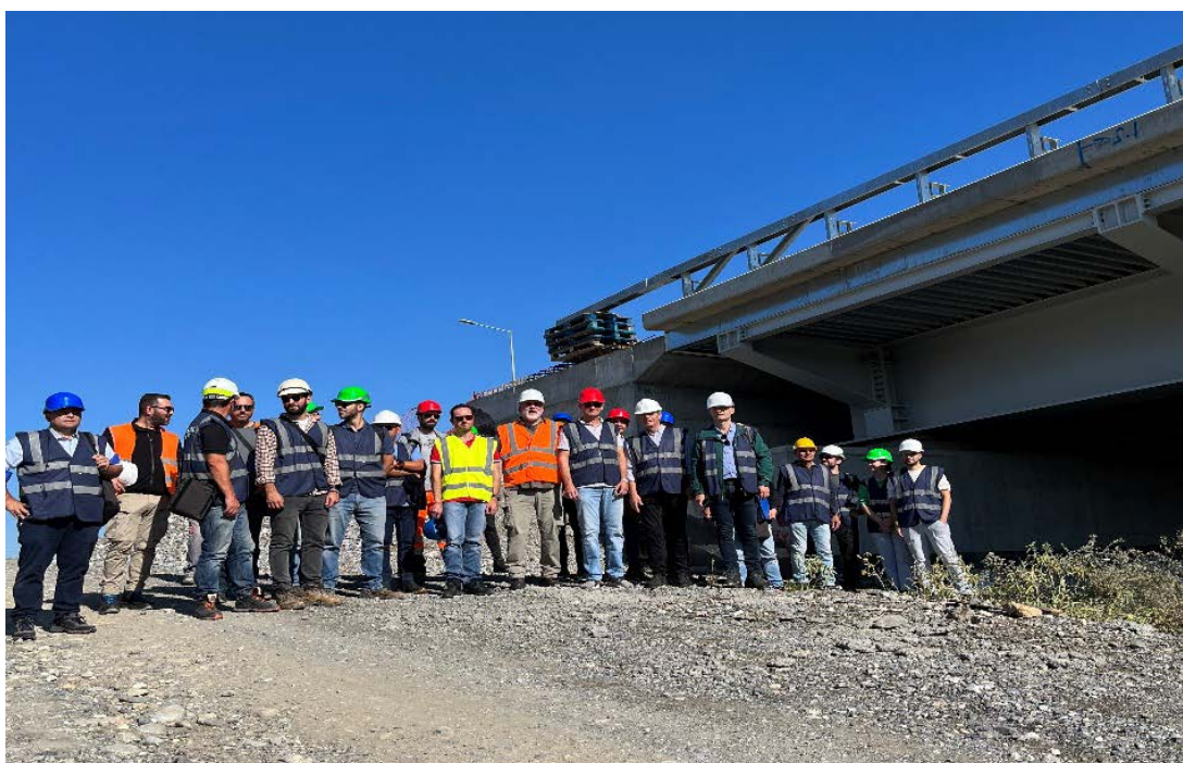
Βόρειος Κλάδος γέφυρας ποταμού Αλιάκμονα

Πραγματοποιήθηκε επιθεώρηση και καταγραφή φθορών/βλαβών σε γέφυρα Κάτω Διάβασης (στην περιοχή Μεθώνης Πιερίας), ενώ στις Οδικές Γέφυρες του ποταμού Αλιάκμονα έγινε ξενάγηση στις γέφυρες Βορείου (προς Θεσ/νικη) & Νοτίου (προς Αθήνα) κλάδου, παρουσίαση εργασιών ανακατασκευής του Βορείου κλάδου και αναφορά σε αξιολογήσεις και δοκιμές που έχουν γίνει στο παρελθόν στον Νότιο κλάδο.