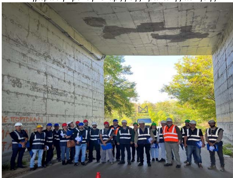
Γέφυρα Κάτω Διάβασης στην περιοχή Μεθώνης Πιερίας