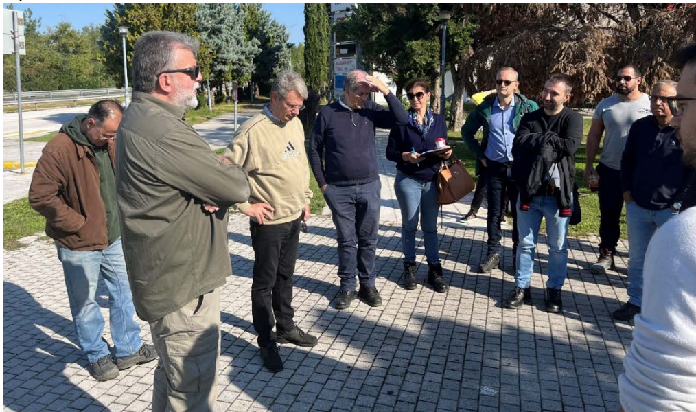
Ενημέρωση πριν την έναρξη της πρακτικής άσκησης

Στις 16/10/2022 πραγματοποιήθηκε επίσκεψη των επιμορφούμενων σε γέφυρα Κάτω Διάβασης στην περιοχή Μεθώνης Πιερίας και στις Οδικές Γέφυρες του ποταμού Αλιάκμονα.