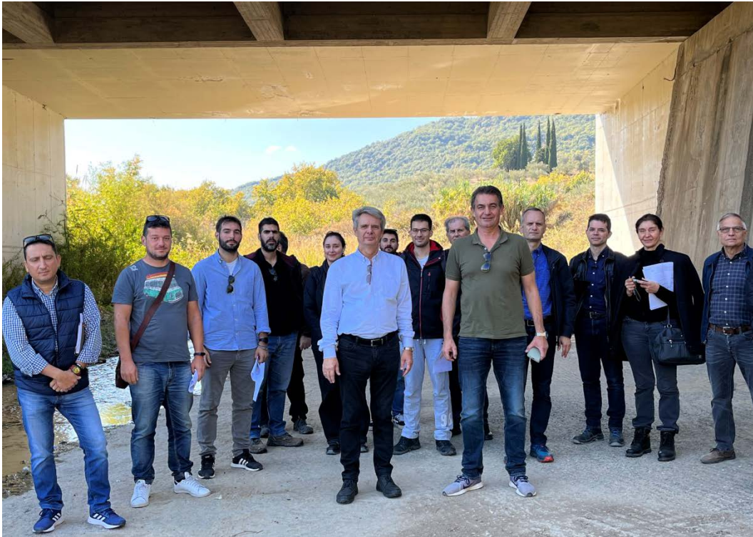
Ομαδική φωτογραφία στη ρεματογέφυρα Καινούργιου

Στις 30/10/2022 οι επιμορφούμενοι επισκέφθηκαν γέφυρες της «Νέα Οδός Α.Ε.» και της «Κεντρική Οδός Α.Ε.».