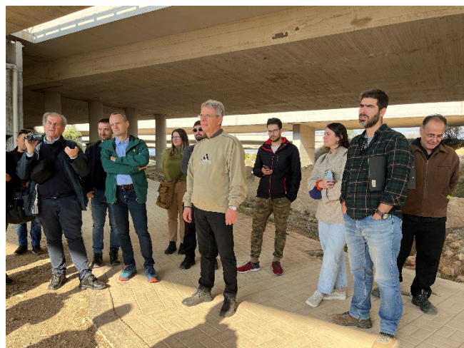
Εισαγωγική παρουσίαση της Γέφυρας Β044 της Ολυμπίας Οδού.