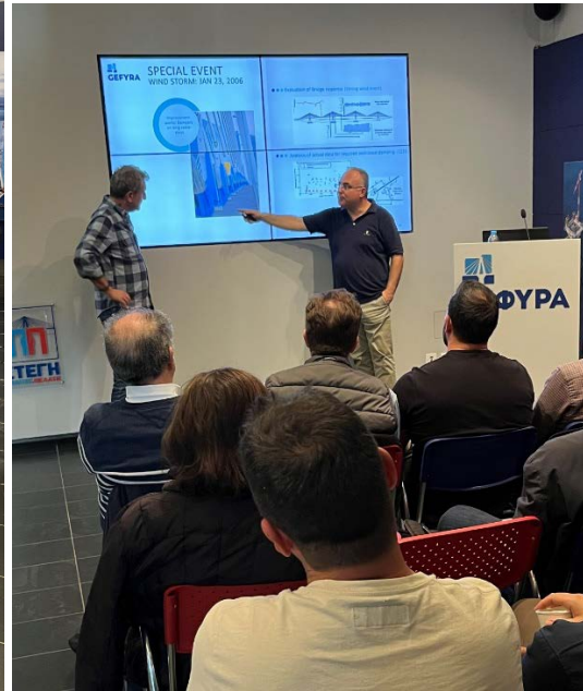
Ενημέρωση για τη Δομική Διαχείριση του έργου Ζεύξης Ρίου - Αντιρρίου