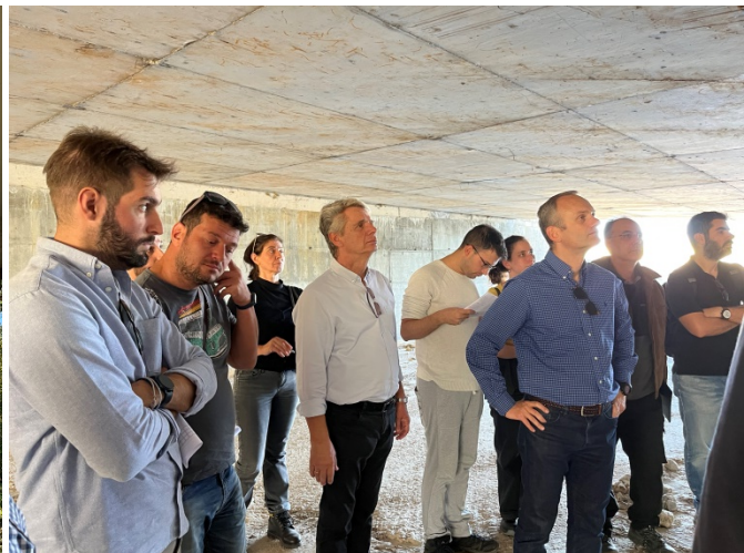
Επιθεώρηση βάθρων και φορέα ρεματογέφυρας Καινούργιου και ρεματογέφυρας Ιαματικών Λουτρών