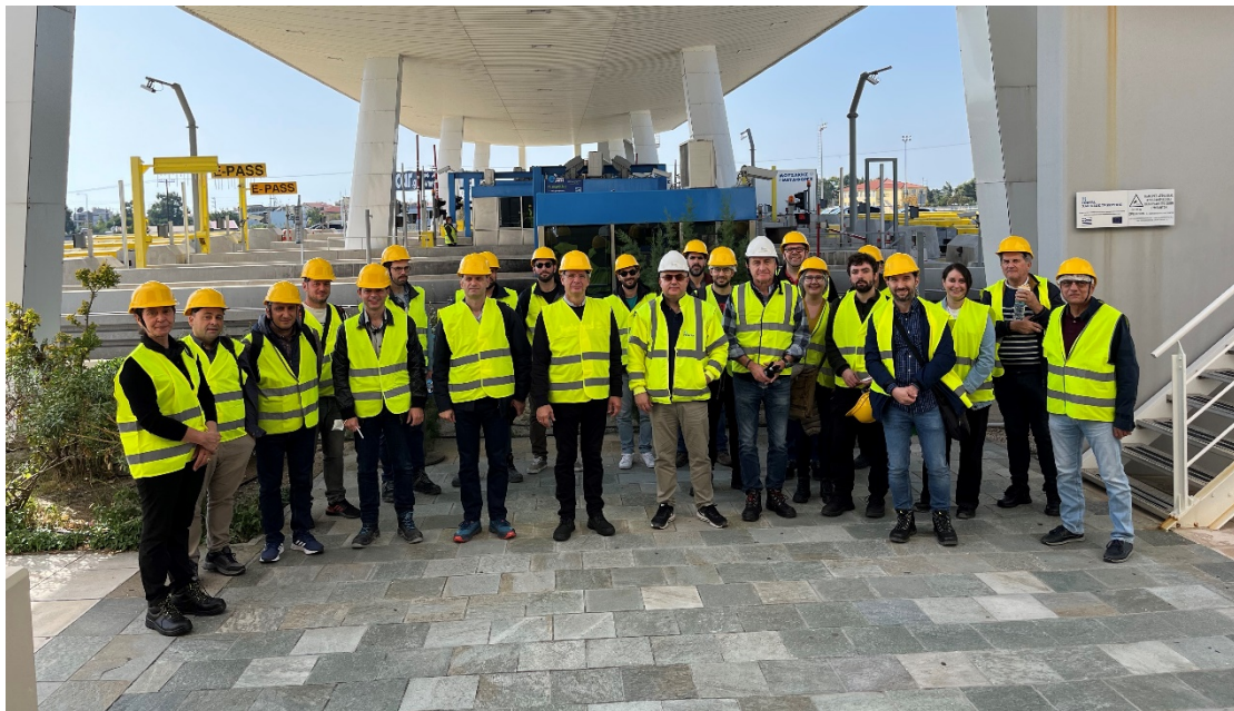
Ομαδική φωτογραφία στον σταθμό διοδίων

Τεχνική επίσκεψη στον πυλώνα Μ4 όπου παρουσιάστηκε ο σημαντικότερος δομικός εξοπλισμός της γέφυρας (καλώδια σύστημα απόσβεσης, αρμοί καλωδιωτής γέφυρας και γεφυρών πρόσβασης, κατάστρωμα, σύστημα εγκάρσιας στήριξης και απόσβεσης καταστρώματος, Σύστημα Δομικής Παρακολούθησης- SHMS).