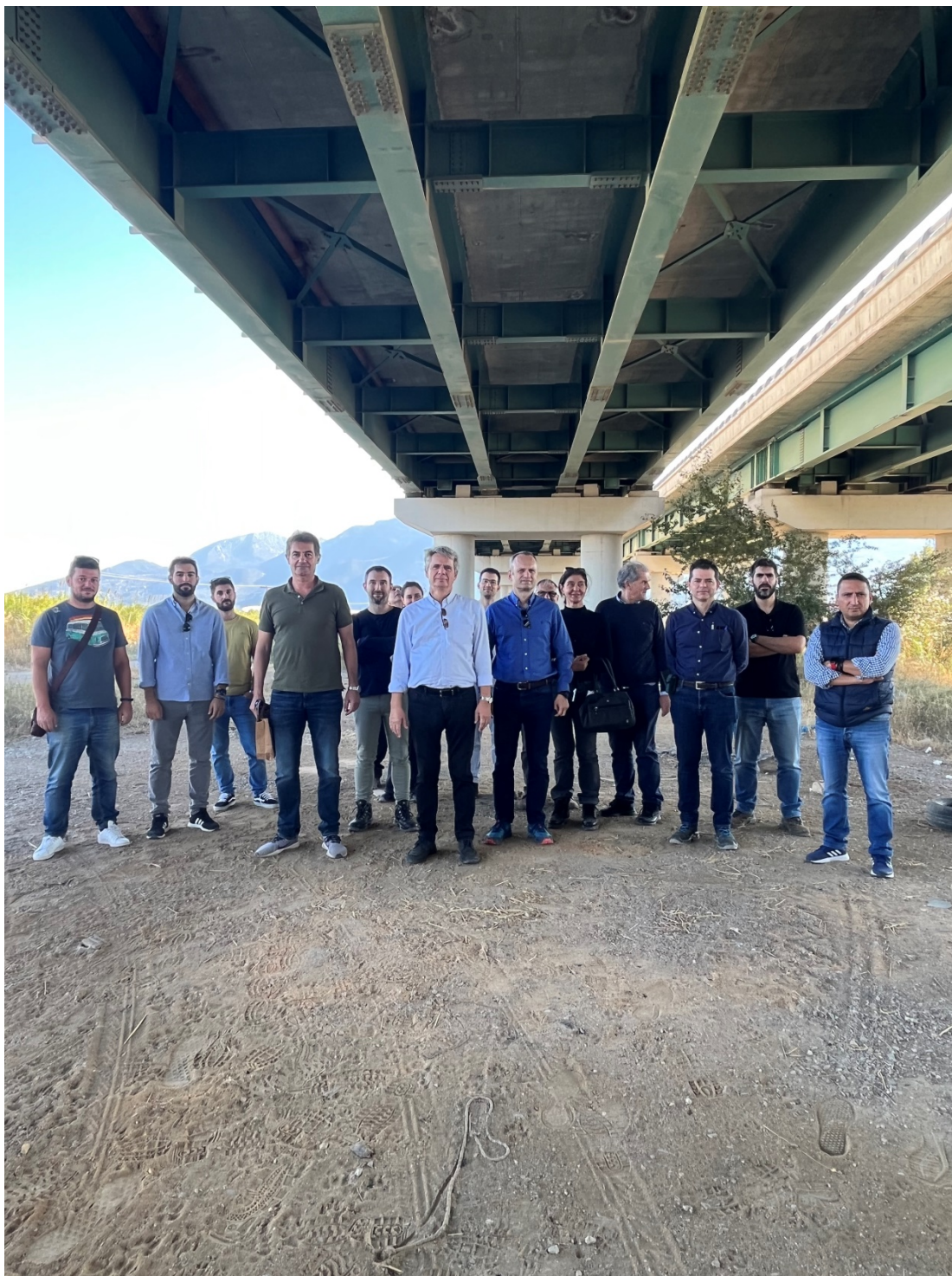
Ομαδική φωτογραφία στον σταθμό διοδίων