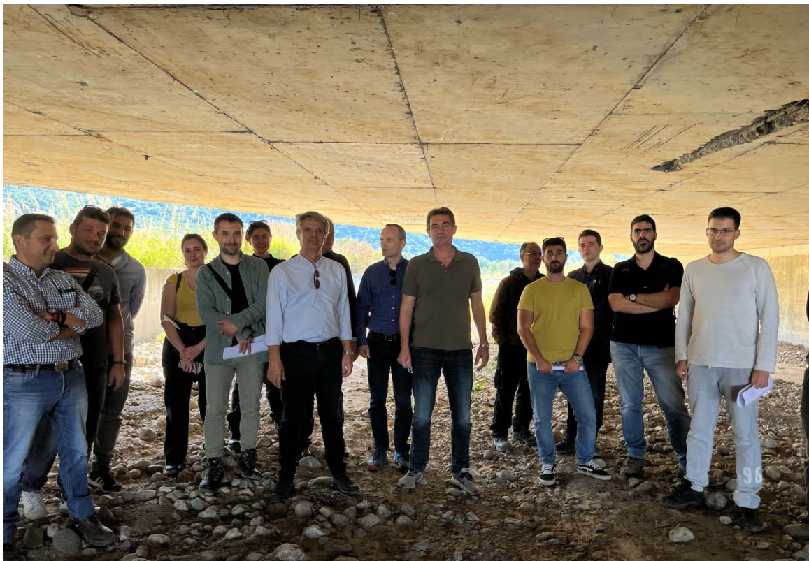
Ομαδική φωτογραφία στη ρεματογέφυρα Ιαματικών Λουτρών.

Πιο συγκεκριμένα, πραγματοποιήθηκε τεχνική παρουσίαση η οποία περιλάμβανε: