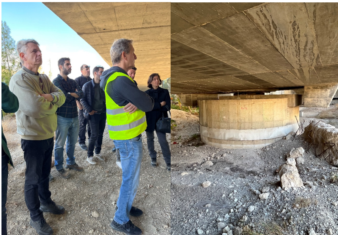
Ενημέρωση για την επικείμενη διαδικασία ανύψωσης της Γέφυρας του Ισθμού για την αντικατάσταση των εφεδράνων σεισμικής μόνωσης του Τεχνικού.