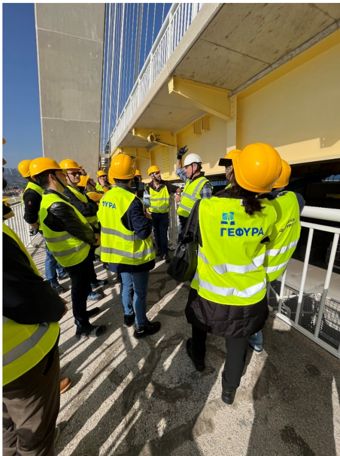
Τεχνική επίσκεψη στον πυλώνα Μ4.