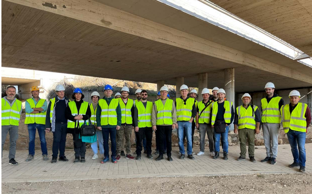
Ομαδική φωτογραφία στη γέφυρα στη θέση του Ιουστινιάνειου Τείχους

Στις 13/11/2022 πραγματοποιήθηκε επίσκεψη των επιμορφούμενων στη Γέφυρα Β044 της Ολυμπίας Οδού, στη ΧΘ 77+140 του Αυτοκινητόδρομου Ελευσίνα-Κόρινθος (άνω διάβαση αυτοκινητόδρομου στη θέση του Ιουστινιάνειου Τείχους) και στο Τεχνικό Β040 Γεφύρωσης του Ισθμού.