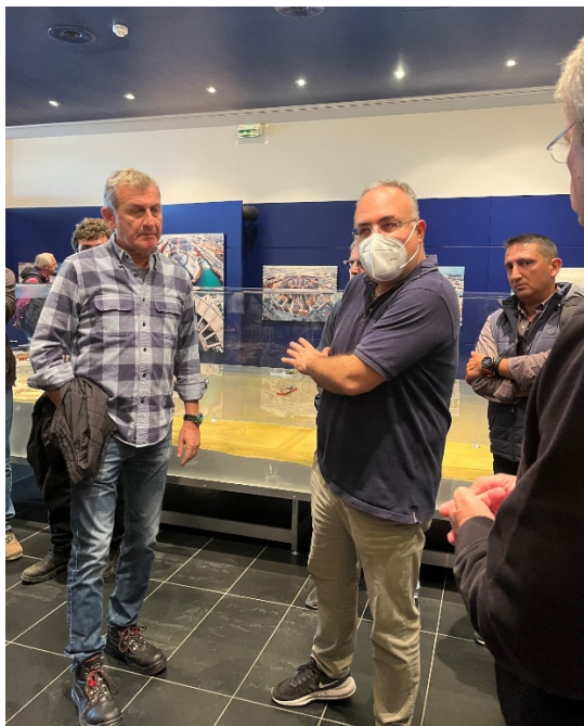
Παρουσίαση και ενημέρωση στη μακέτα του έργου Ζεύξης Ρίου - Αντιρρίου