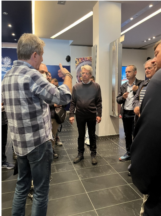
Προκαταρκτική ενημέρωση στο κτήριο Λειτουργίας της γέφυρας

Στις 23/10/2022 πραγματοποιήθηκε επίσκεψη των επιμορφούμενων στην Γέφυρα Ρίου – Αντιρρίου.