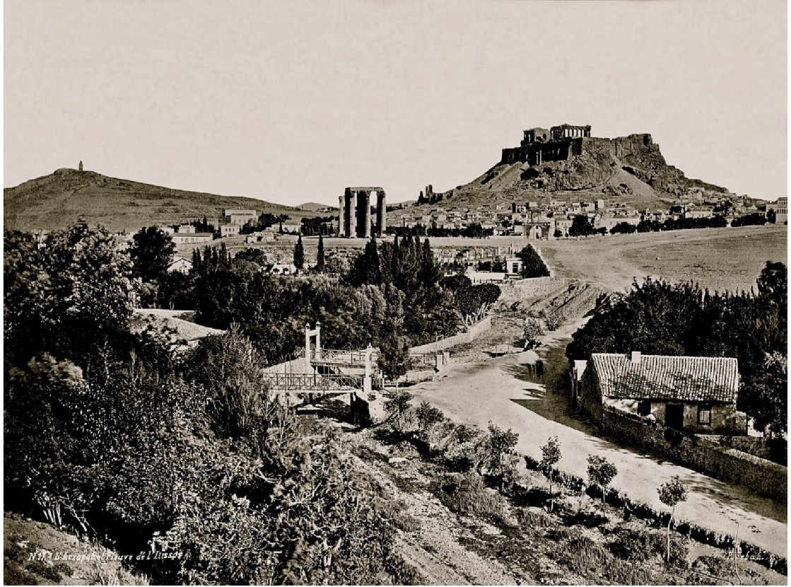
Εικ. 3. Φωτογραφία του 1880 στο Βατραχονήσι. Στο κέντρο γεφυράκι κοντά στην πηγή.